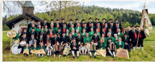
Zum 75-jährigen Gründungsjubiläum stellen sich alle Mitglieder des Trachtenvereins D'Freudenseer für ein Foto bei der Vertriebsliste in der Ortsheimat (Juni 1948)