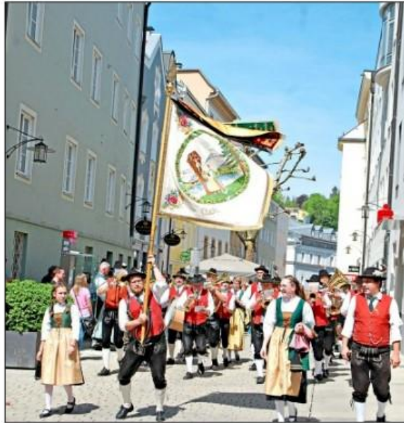
Der Trachtenverein D'Freudenseer feiert mit dem Gautrachtenfest in Hauzenberg sein 75-jähriges Gründungsjubiläum.

Das Gautrachtenfest beginnt am Samstag, 12. August, mit dem Gauheimatabend im Trachten-