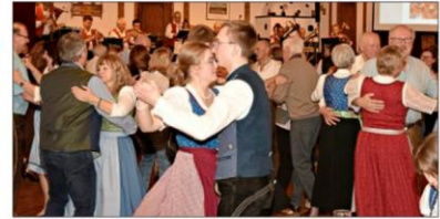
Der Tanzboden im Trachtensaal in Raßreuth war beim Bauernball stets voll.

Tanzboden „gestürmt“ wird. So kommt der Volkstanz wieder dahin, wohin er gehört – unter's Volk. Damit war der Bauernball für die Freudenseer Trachtler der gelungene Start in das Jubiläumsjahr, das im August mit der Feier des 75-jährigen Gründungsfestes im Rahmen des Gautrachtenfestes in Hauzenberg seinen Höhepunkt finden wird. – hc