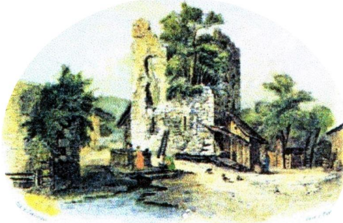
Heimat- und Volkstrachtenverein D'Freudenseer e.V.