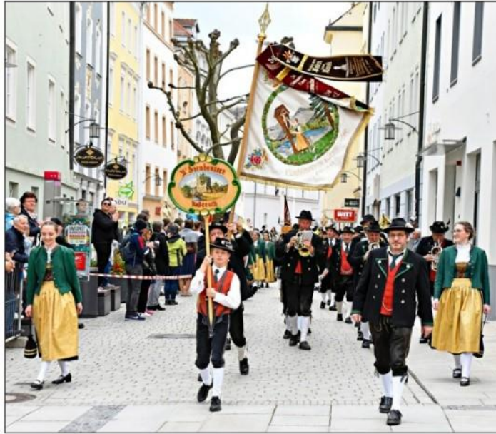
Die Mitglieder des Trachtenvereins „D'Freudenseer“ samt ihrer Trachtenkapelle sind eine feste Größe in der Region und auch beim Maidultfestzug – hier eine Aufnahme aus diesem Jahr in der Passauer Fußgängerzone – nicht wegzudenken. Nun richten sie anlässlich des 75-jährigen Bestehens ihres Vereins das Gautrachtenfest aus, das im Rahmen der Hauzenberger Dult stattfinden wird.

Am Samstag, 12. August, findet der Gauheimatabend im Trachtensaal in Raßreuth statt. Dieser beginnt um 19 Uhr. Die Freudenseer freuen sich auf viele, viele Besucher bei dieser Veranstaltung. Denn an diesem Abend wollen die Trachtler besonders einen Blick auf die 75 Jahre Vereinsgeschichte werfen – beim einen oder anderen